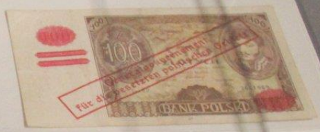
100 złotych 9 listopada 1934 seria AA, Generalne Gubernatorstwo - nadruk. Stan 3. Fałszykat wykonany na zasadę niemieckiego emitenta (szepiel zamiast nadruku). Banknoty te znajdowały się w obiegu w czasie okupacji hitlerowskiej od stycznia do maja 1940 roku. Walory 100 złotych z emisji 1932 i 1934 - były nadruk Generalgouvernement für die besetzten polnischen Gebiete - Generalne Gubernatorstwo dla zajętych polskich obszarów. Najczęściej na rynku kolekcjonerskim występują stany trzeci, gdyż okupant przedrukowywał walory już znajdujące się w obiegu.

Najbardziej widoczną różnicą od oryginałów był brak kropek na frędzlach postaci minceza, Stanisława Drewno przedstawionej na awersie waloru. Cechę tą można bez trudu dostrzec gołym okiem. Ponadto jest sporo detali w postaci różnej ilości kreszek w wizerunku wspomnianej postaci, które można zauważyć porównując fałszykat z oryginalnym walorem. Istnieją także niewielkie różnice kolorystyczne w przypadku nasycenia farby drukarskiej trudne do jednoznacznego zdefiniowania. Istnieje przypuszczenie, że te niewielkie różnice były poczynione przez podziemie świadomie, aby mieć narzędzie służące członkom państwa podziemnego do rozpoznawania tych banknotów.